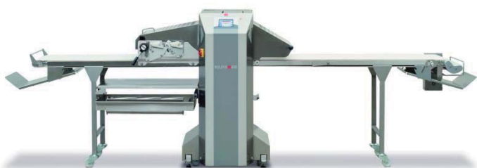
写真：ロールフィクス 600C