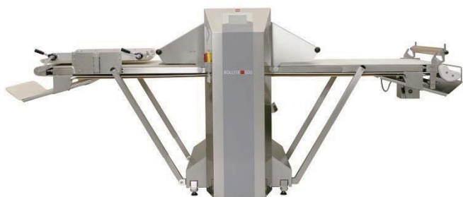
写真：ロールフィクス 600W